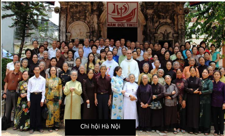
Chi hội Hà Nội