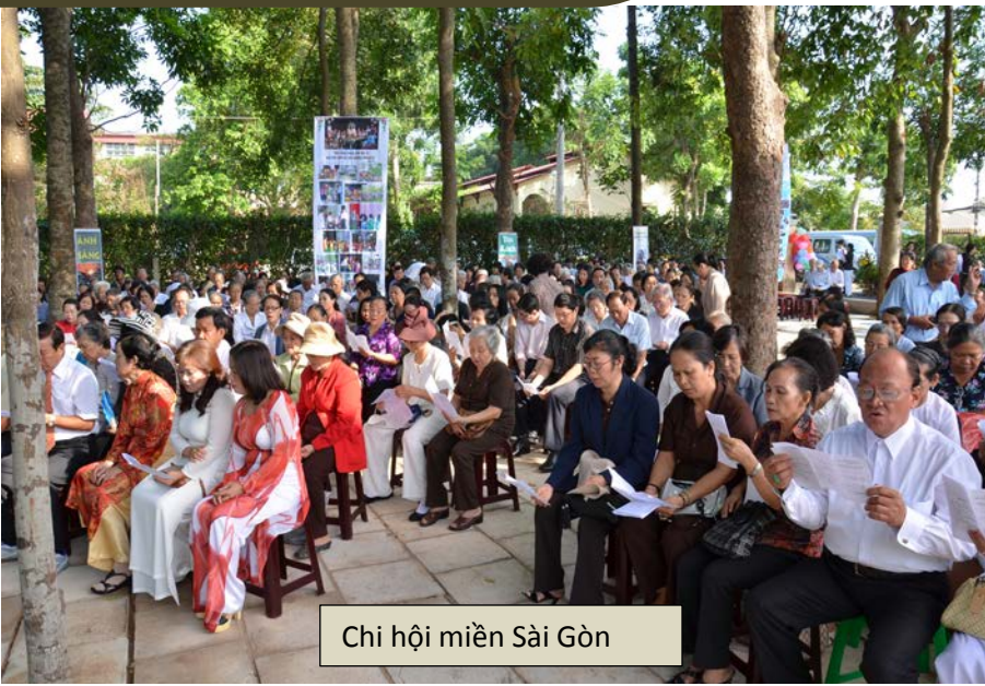
Chi hội miền Sài Gòn