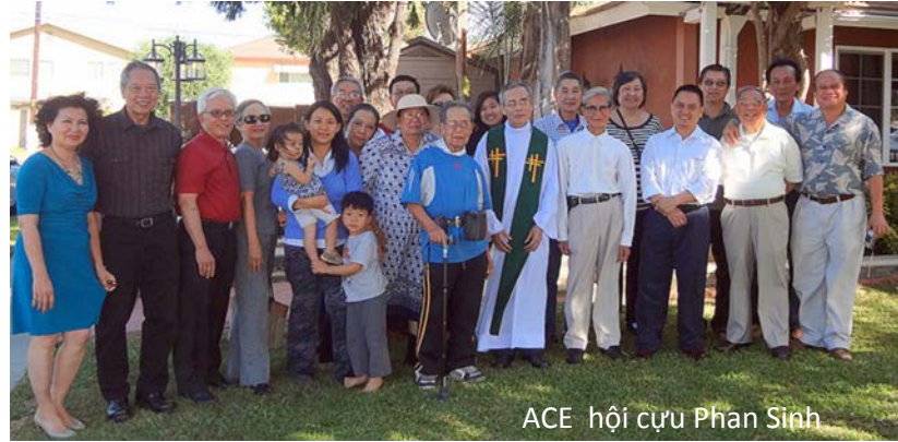
ACE hội cựu Phan Sinh