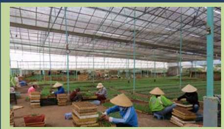
Anh em tại cộng đoàn Phanxicô Du Sinh giúp cho hơn 70 người dân địa phương có công ăn việc làm nơi cơ sở cây giống của Nhà Dòng tại thành phố Dà Lạt .