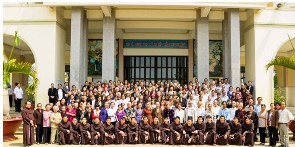
Chi hội Bảo Lộc