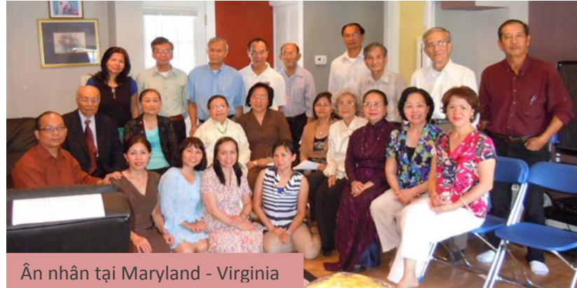
Ân nhân tại Maryland - Virginia