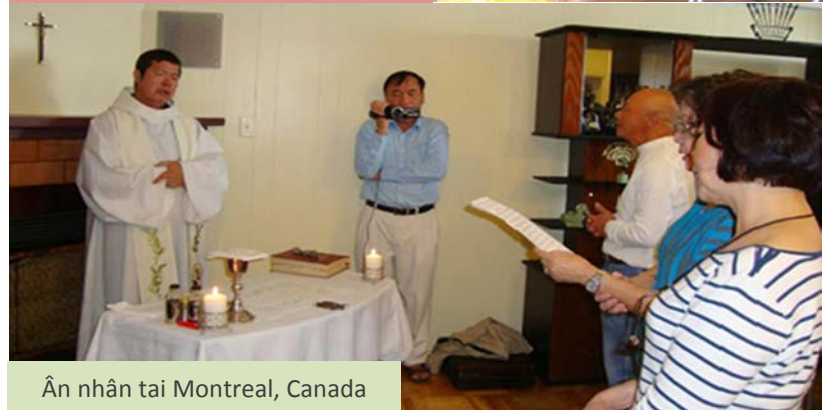
Ân nhân tại Montreal, Canada