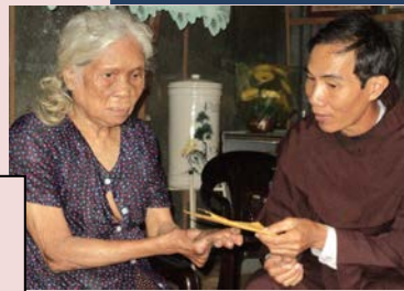
Anh em tại cộng đoàn Phanxicô Cù Lao Giêng - tỉnh An Giang , khám và chữa bệnh cho người dân trong vùng.