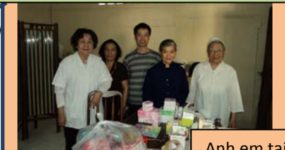
Anh em tại cộng đoàn Phanxicô Cầu Ông Lãnh - Sài Gòn phát thuốc cho dân nghèo.